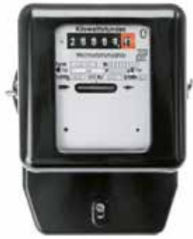
العداد التناظري للكهرباء