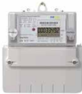
العداد الرقمي للكهرباء