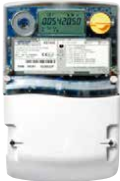
العداد الرقمي للكهرباء

كيف أجد العداد الخاص بي؟ كل عداد له رقم. وهذا الرقم الخاص بالعداد موجود مرة واحدة فقط. لذلك، يمكننا استخدام هذا الرقم لتحديد مكان الاستهلاك.